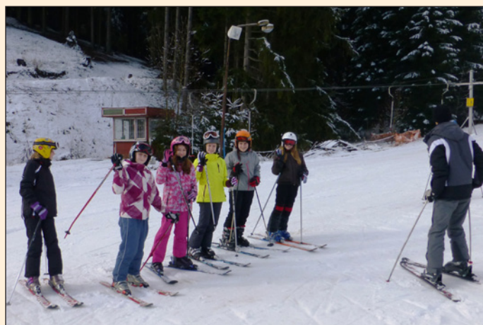
Lyžařský kurz ve Velkých Karlovicích