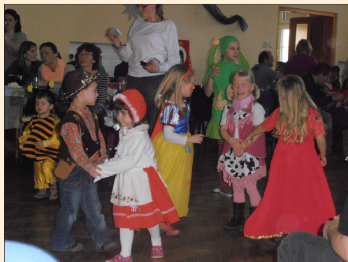
Maškarní ples MŠ