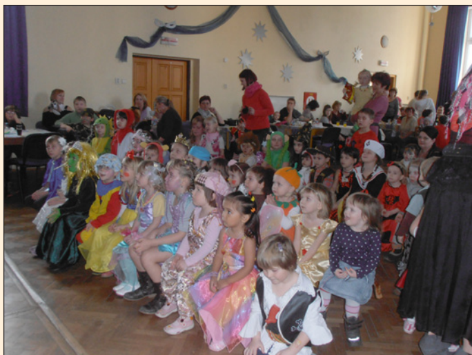
Maškarní ples MŠ