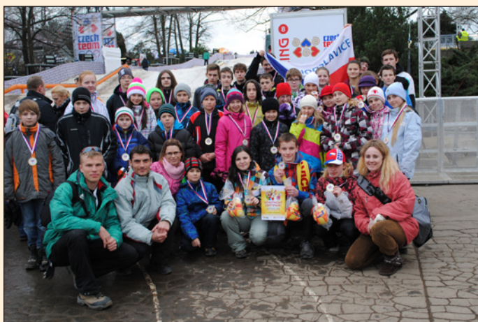
Den v Olympijském parku Letná