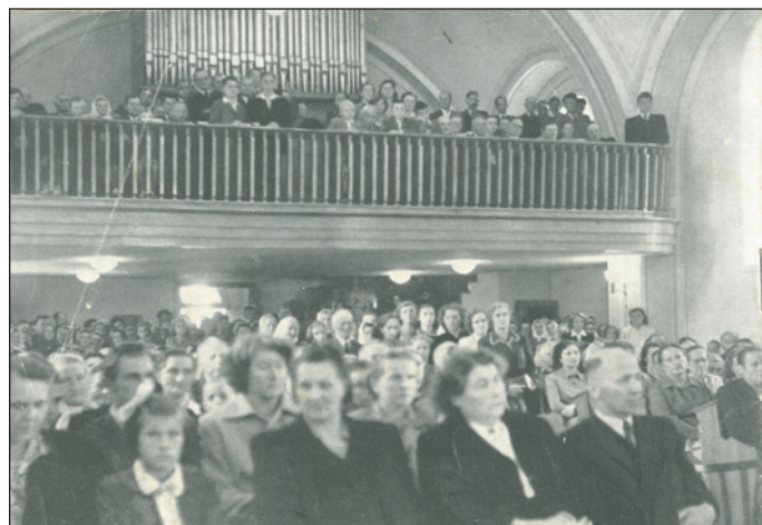
Celkový pohled na zaplněný kostel včetně opravené galerie a varhan. ( Pamětníci, hleďte se ).

pro zajímavost – Hostašovice /1784/, Veřovice /1788/, Mořkov-katolická /1844/ a evangelická /1896/. Hodslavice otevřely katolickou školu v r. 1856 a evangelickou v r. 1900. Měšťanská škola byla u nás otevřena v r. 1920 a ve třech třídách měla 77 žáků.