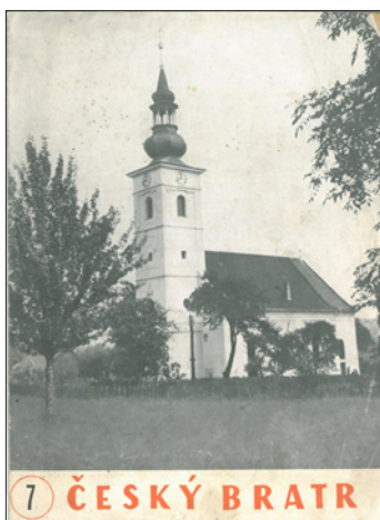
7 ČESKÝ BRATR

V úmorných vedrech letošního léta jsem se v relativním chládku bytu probíral letitými písemnostmi, novinami a dalšími pečlivě strážnými materiály, ve kterých jsou různými způsoby zmapovány některé etapy života naší obce. Jistě jsem neobjevil Ameriku, protože vše podstatné je obsaženo v obecní kronice, ale ta není vždy k dispozici, a tak jsem se rozhodl připomenout tyto okamžiky prostřednictvím našeho Zpravodaje hodslavské veřejnosti.