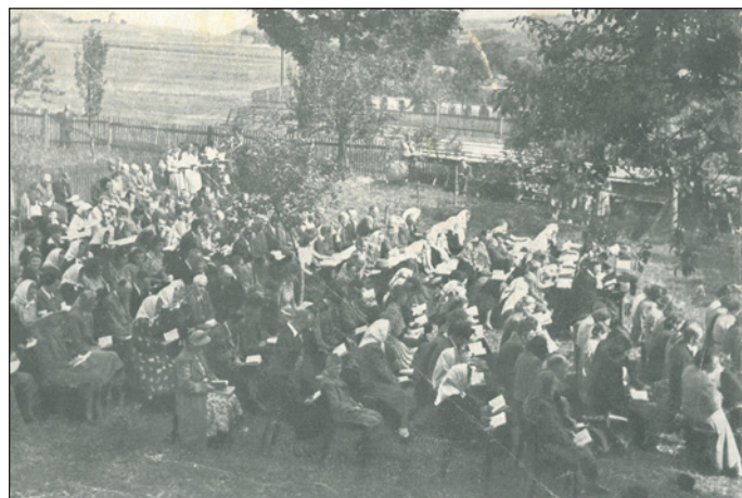
Pro ty, na které místo v kostele nebylo, bylo připraveno sezení na zahradě staré školy. Bohoslužba byla přenášena reproduktory.

Velice podrobně je zde také popsána činnost veřejných obecních knihoven. I zde se naši předkové snažili a za podpory obce prospívala knihovna nejširším vrstvám obyvatel. Jenom pro představu – v roce 1928 měly Hodslavice 1739 obyvatel (podle sčítání v r. 1921), v knihovně bylo 905 svazků, 79 evidovaných čtenářů a v průběhu celého roku se uskutečnilo 1757 výpůjček.