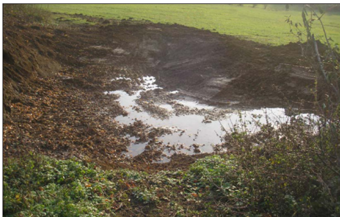
lokality Zadní lések

Taky do naší školičky přišli koledovat Tři králové. A ne jen tak ledajací. Protože se nám svátek Tří králů moc líbí, udělali jsme