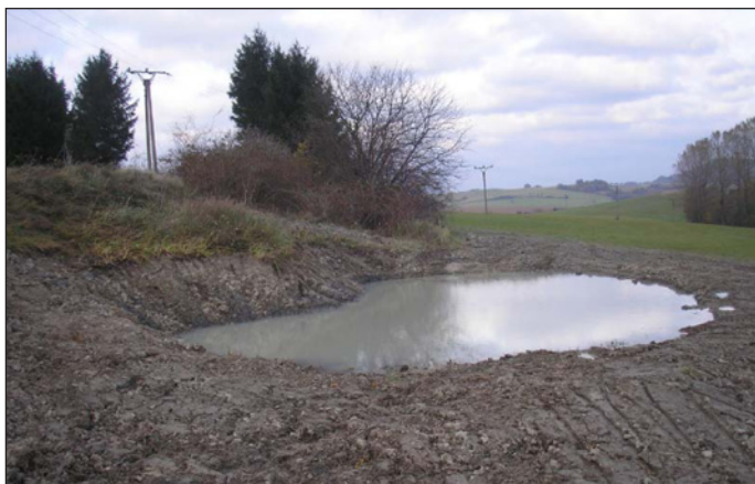
lokality pod Hůrkami

spáchaných tak, aby se krajina stala „přívětivou“ pro obyvatelé obce a návštěvníky přírody a aby došlo ke zlepšení přírodních podmínek nutných pro existenci druhové rozmanitosti rostlinných a živočišných společenstev. V roce 2011 byla na objednávku Agentury ochrany přírody a krajiny v Ostravě zpracována fy. Arvita P Otrokovice krajinářské studie s názvem Podpory ekologické stability krajiny v k.ú. Hodslavice . Tato studie obsahuje mimo jiné řadu návrhů lokalit k vybudování malých vodních tůň, které by měly sloužit jak ke zlepšení retenčních schopností krajiny, tak k podpoře života rostlinných a živočišných společenstev vázaných na vodu. Stejně jako na řadě jiných území i na našem katastru je vážným problémem krajiny neschopnost dlouhodobě zadržovat vodu.