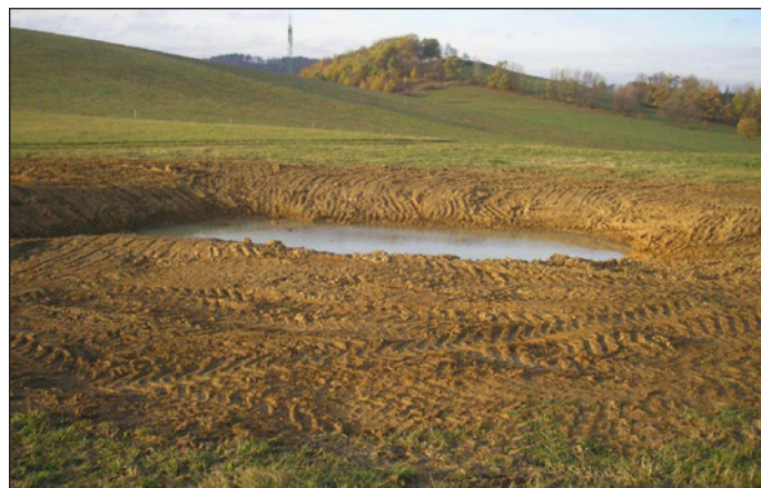
lokality za Včelínem

spáchaných tak, aby se krajina stala „přívětivou“ pro obyvatelé obce a návštěvníky přírody a aby došlo ke zlepšení přírodních podmínek nutných pro existenci druhové rozmanitosti rostlinných a živočišných společenstev. V roce 2011 byla na objednávku Agentury ochrany přírody a krajiny v Ostravě zpracována fy. Arvita P Otrokovice krajinářské studie s názvem Podpory ekologické stability krajiny v k.ú. Hodslavice . Tato studie obsahuje mimo jiné řadu návrhů lokalit k vybudování malých vodních tůň, které by měly sloužit jak ke zlepšení retenčních schopností krajiny, tak k podpoře života rostlinných a živočišných společenstev vázaných na vodu. Stejně jako na řadě jiných území i na našem katastru je vážným problémem krajiny neschopnost dlouhodobě zadržovat vodu.