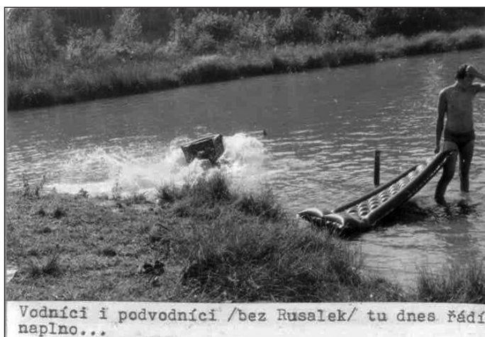
Vodníci i podvodníci /bez Rusalek/ tu dnes řadí naplno...