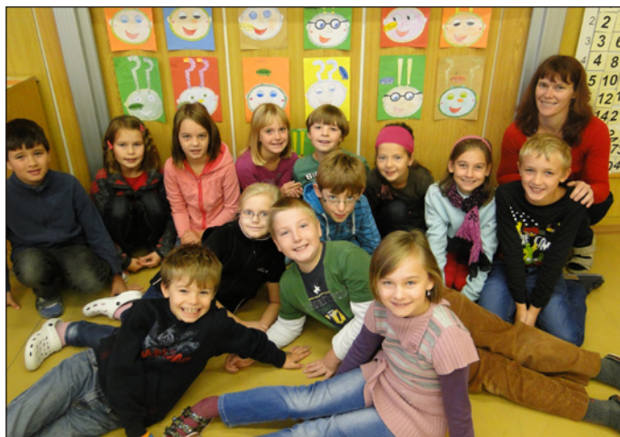
3. třída - den jazyků

Na adaptáku jsme byly, Terky nás toho hodně naučily. Byly tam dobré obědy, ráno jsme se flákaly. V golfu jsme do jamek míčky házely, potom jsme v dostihách na koně sázely. Básničky jsme si moc nepamatovaly a věže nám nakonec na nohy popadaly. Poslední večer jsme kasino měly, ruletu, Black Jack a kostky jsme hrály. Nakonec jsme se loučily a všechny jsme ohromily. PS: Do školy jsme se (vůbec) netěšily. ☺