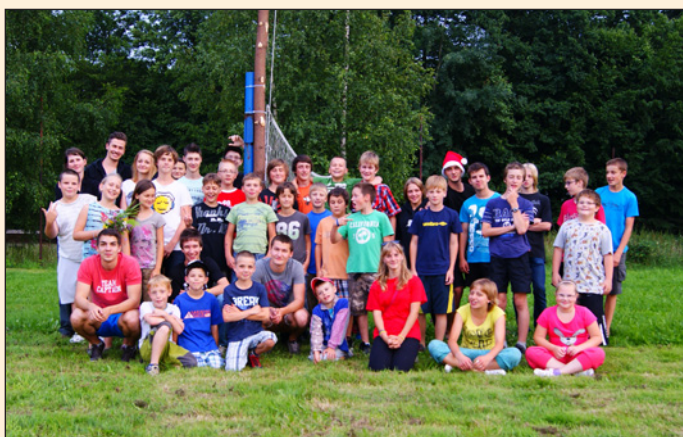
letní tábor SHM Hodslavice