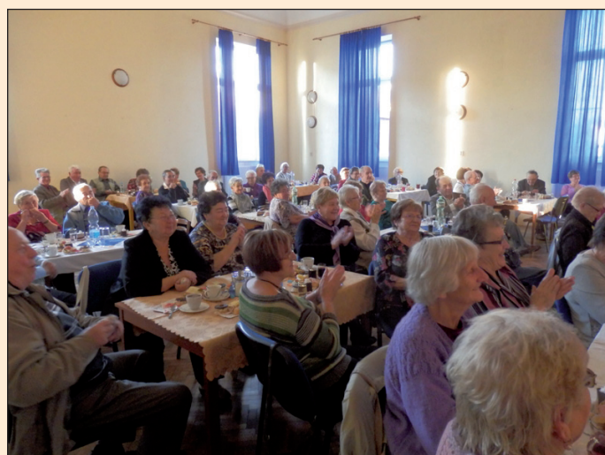
Setkání s jubilanty