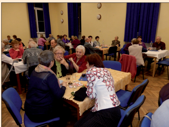
Setkání s jubilanty