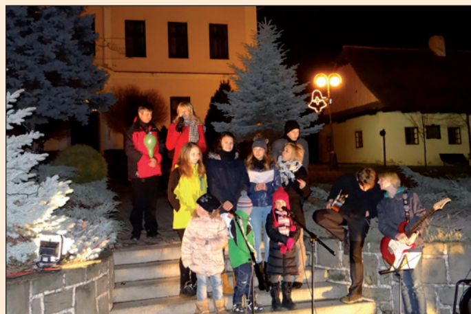
Rozsvícení vánočního stromčku