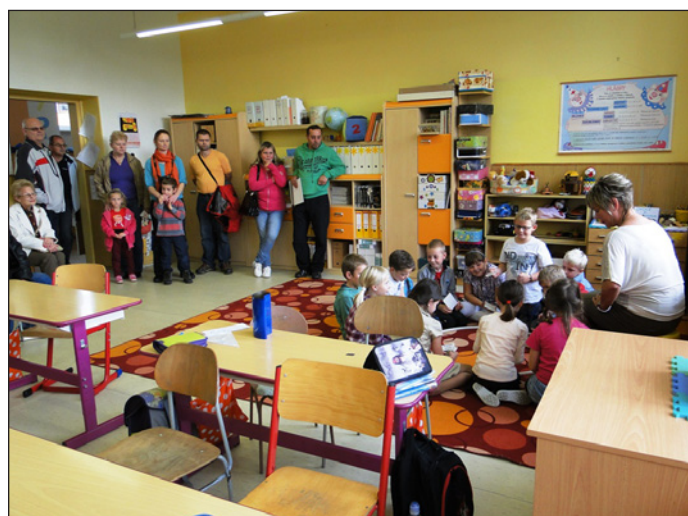
Den otevřených dveří

Ve středu 9. října jsme dojeli do pingpongařské haly v Loučce, po rozcvičení začali měřit své síly s kluky ze ZŠ Komenského Nový Jičín a ZŠ Starý Jičín. Naše výkony nebyly vůbec špatné, byli jsme jen horší v koncových míčcích. Umístili jsme se na třetím místě, ale hodně cenné byly pro kluky zkušenosti z prvního turnaje a v příštím roce bude jejich výsledek určitě o mnoho lepší.