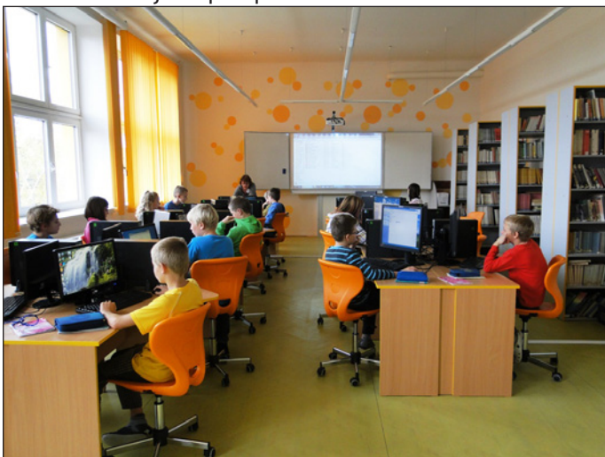
Den otevřených dveří

V osmém ročníku navštěvují informační centrum úřadu práce, kde dostávají odborné informace o nabídce a poptávce na trhu práce, dostávají nabídku konzultace spolu s rodiči a vykonávají testu studijních předpokladů.