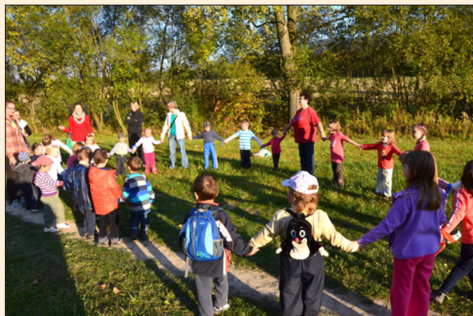
Mateřská škola - hledání pokladu