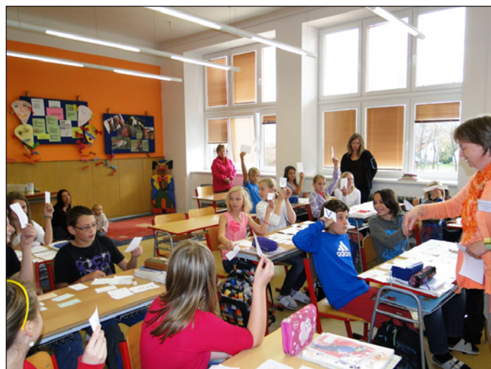
Den otevřených dveří

Je už konec října, školní rok je v plném proudu. Před žáky devátého ročníku a před jejich rodiči je jedno z nejsložitějších životních období. Rychle se blíží leden, čas odevzdávání přihlášek na střední školu. Blíží se konec povinné školní docházky a nastává otázka: „Kam dále? Která střední škola je ta pravá? Rozhodneme se správně ...?“