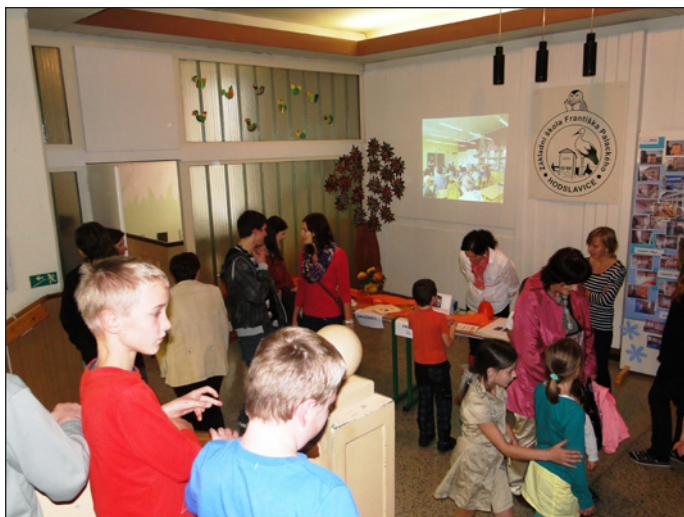
Den otevřených dveří

Rodiče žáků mohli ochutnat z nabídky kuchařek školní jídelny, které připravily několik druhů svačinek.