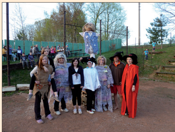
Pálení čarodejnic, 26.4.2013