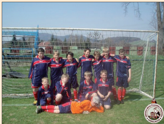
McDonald's Cup, 4. - 5. třída ZŠ