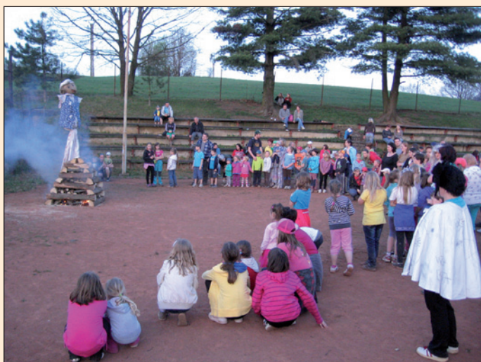
Pálení čarodejnic, 26.4.2013