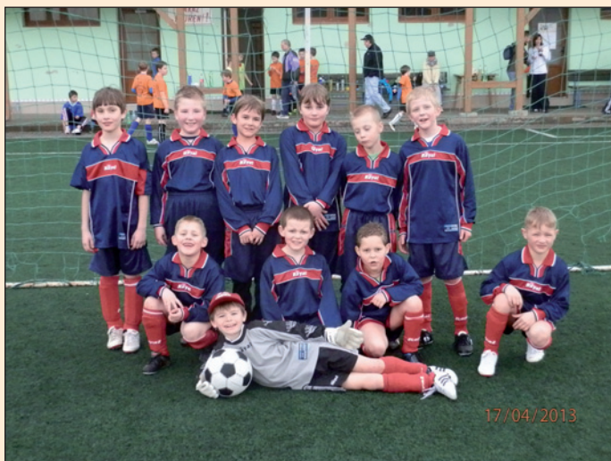
McDonald's Cup, 1. - 3. třída ZŠ