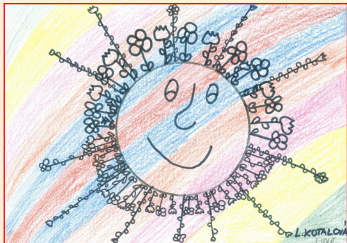
autorka: Ludmila Kotalová, 3. třída ZŠ

Přejeme hodně zdraví, spokojenost a rodinnou pohodu.