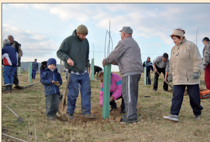
výsadba obecního sadu starých odrůd pod Větrákem

V letošním roce nás čekají další práce související s chodem obce – převzali jsme do správy vodovod, chceme modernizovat sociálky na ZŠ. Realizovat se bude projekt Protipovodňová opatření obcí Novojičínska (instalace nového bezdrátového rozhlasu), na něj byla schválena dotace MŽP ČR. Podařilo se nám snížit provozní výdaje obce a získat dotace na krajinotvornou studii, která bude jedním z podkladů nového územního plánu obce, který se letos začne tvořit. Dalším podkladem k rozvoji obce budou výsledky dotazníkového šetření, které nyní zpracováváme. Společně se určitě zase pobavíme na Dni obce, letos ve sportovním duchu a také nás čeká další významné výročí a to oslavy 80 let existence Pamětní školy Františka Palackého, které proběhnou v červnu. Doufáme, že se nám naše plány podaří v co největší míře realizovat, věříme, že nám s nimi také pomůžete, a přejeme i Vám všem plodný a úspěšný rok 2012.