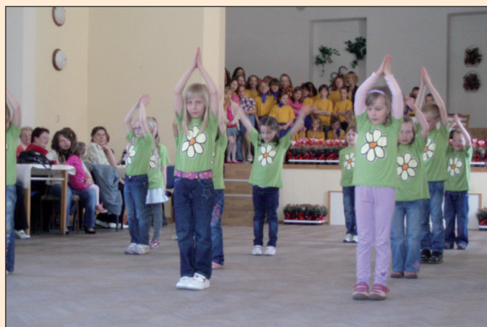
oslava Dne matek ve Společenském domě