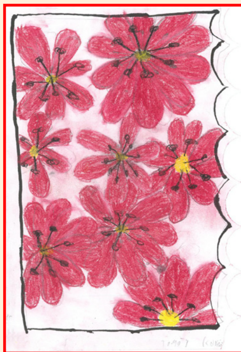
autor: Tomáš Kovář, 7.třída ZŠ

Vítáme narozené dítě do svazku naší obce a přejeme mu mnoho úspěchů v nastávajícím životě.