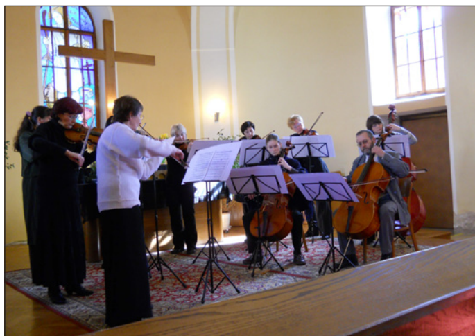
Komorní orchestr Pavla Josefa Vejvanovského