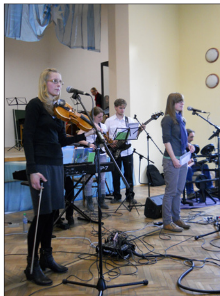
Hudební skupina evangelické mládeže

Druhý koncert se uskutečnil o týden později v neděli 1. dubna ve společenském domě v Hodslavicích. Na pódiu se během hodiny a půl dlouhého programu vystřídal Smyčkový orchestr a soubor ZUŠ Valašské Meziříčí, Hudební skupina evangelické mládeže a cimbálová muzika Trojačka.