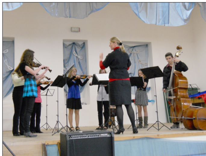
Smyčkový orchestr a soubor ZUŠ Valašské Meziříčí