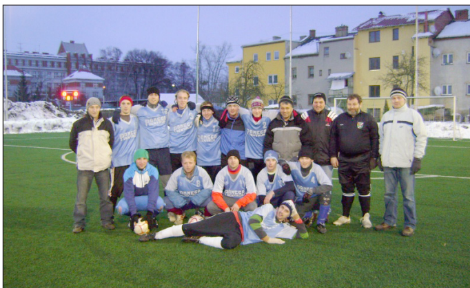
příprava na umělé trávě