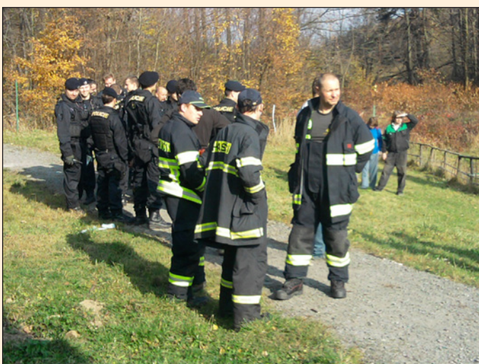
pátrání po pohřešované osobě

a s policií byla vytvořena rojnice a prohledával se les v okolí Zrzávek a dále kolem hospůdky Na hájovně. Kvůli lepší technické vybavenosti jsme také prohledávali rozpadlé domy a jiné prostory, kam policie měla obavu vstoupit. Pátrání probíha-