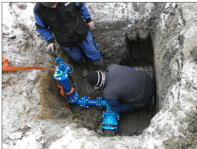
10.2. oprava vodovodu

29.2. Podání žádostí o dotace na projekty zateplení ZŠ a MŠ v on-line systému OPŽP.