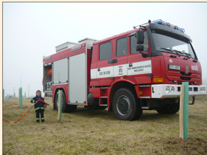
zálivka výsadby starých odrůd

Mimo evidovaných událostí jednotka prováděla na žádost Obecního úřadu v Hodslavicích i Živicích čištění kanálů, studní, propustí a dovoz vody. Dále jsme byli nápomocni při výsadbě stromků a keřů v obci a jejím okolí – a to prováděním záливоk.