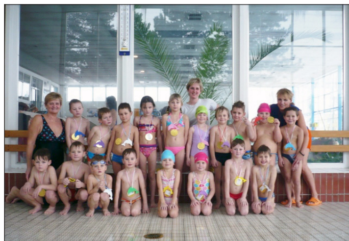
MŠ na předplaveckém výcviku