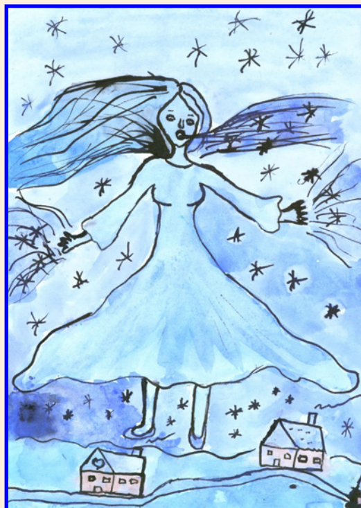
autorka: Natálie Býmová, 3.třída ZŠ

Vítáme narozené děti do svazku naší obce a přejeme jim mnoho úspěchů v nastávajícím životě.