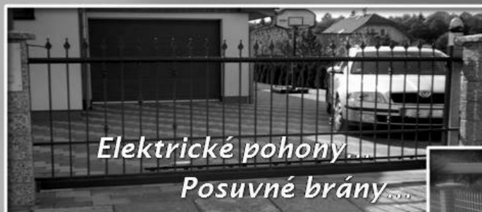
Elektrické pohony... Posuvné brány...