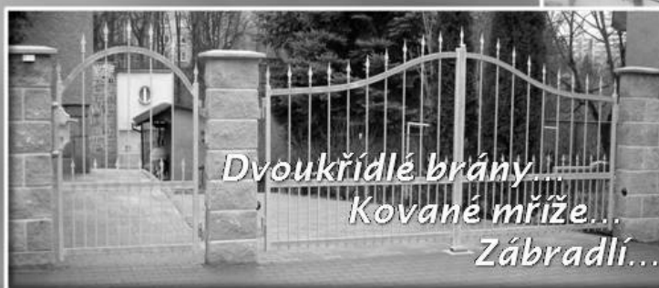
Dvoukřídle brány... Kované mříže... - Zábradlí...

Dále zajišťujeme: práce s polykarbonátem, kované nábytek, kovovýroba