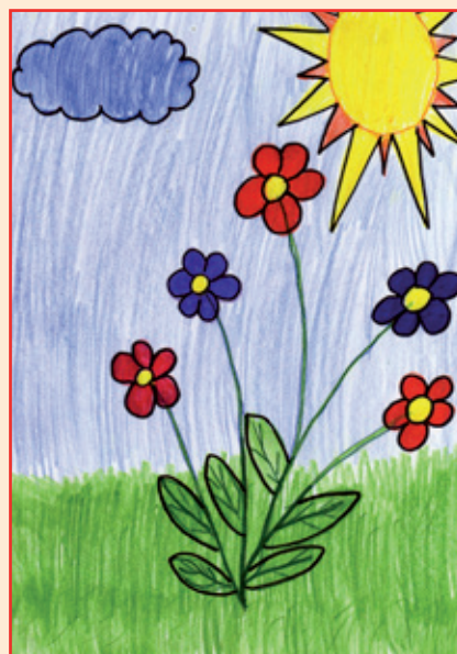
autor: Zuzana Mičulková, 1.třída ZŠ

Vítáme narozené děti do svazku naší obce a přejeme jim mnoho úspěchů v nastávajícím životě.