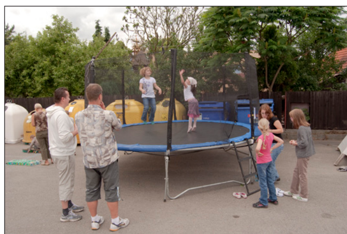
Pro děti měli místní TJ Sokol společně s Royal Rangers 7ph připraveny různé hry a soutěže