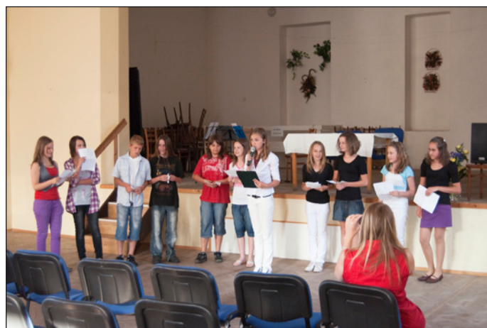
Po vernisáži v Kulturním domě žáci 7. třídy prezentovali svůj projekt „Život a školství za doby Františka Palackého a dnes“