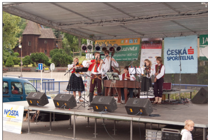
Dalším účinkujícím byla místní dětská cimbálová muzika Trojačka