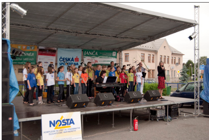
Program Dne obce zahájil dětský pěvecký sbor Kulihrášek z Nového Jičína