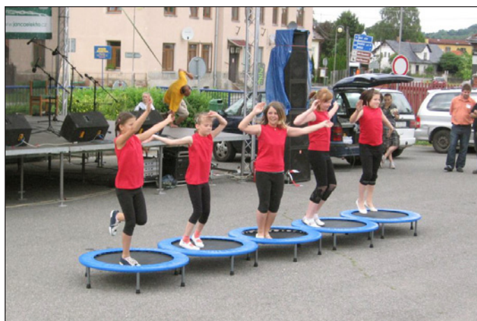
Cvičení na trampolínách předvedly žákyně TJ Sokol Hodslavice