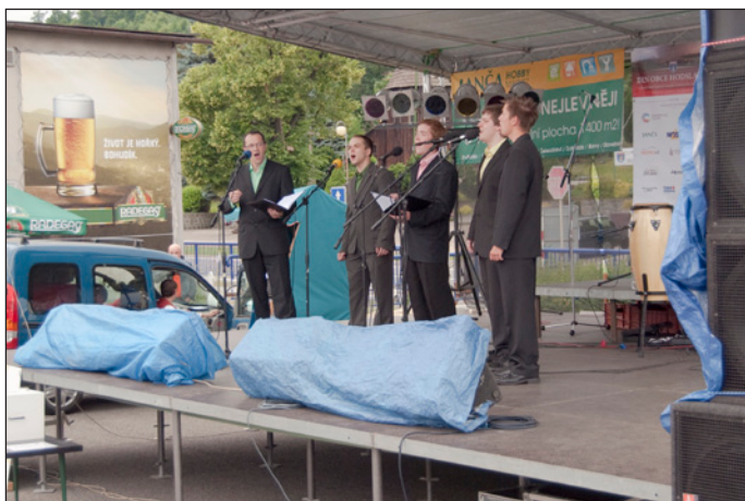
Dalším vystupujícím byla novojičínská chlapecká vokální skupina Sextet