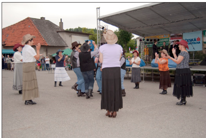
... a ještě jednou HOBA