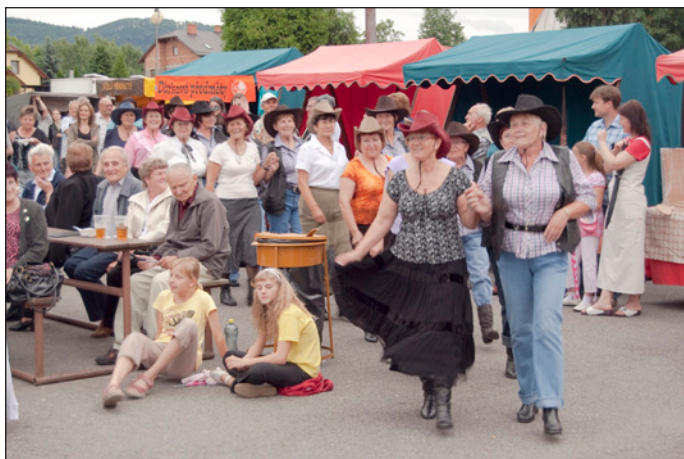
Jedním z vrcholů Dne obce bylo vystoupení „Hodslavských BAB“ z místního Klubu důchodců