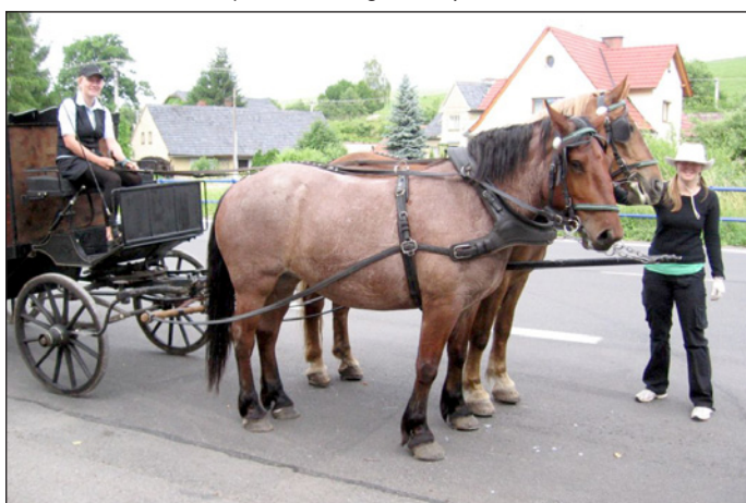
Na projížďku po Hodslavicích se mohli návštěvníci Dne obce vydat v koňském spřežení