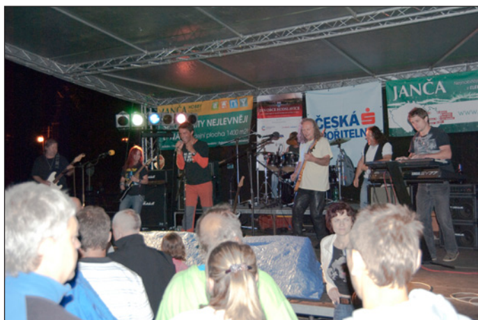
Dalším vrcholem Dne obce bylo vystoupení skupiny Věšák z Nového Jičína, u kterého jsme mnozí zavzpomínali na své mládí