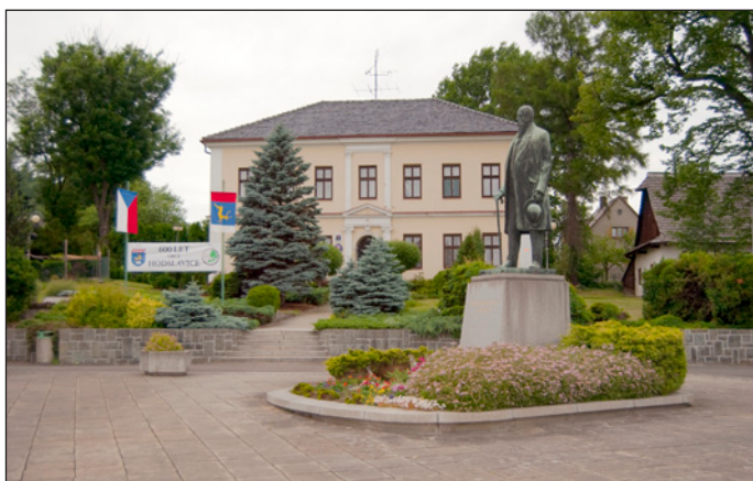
Sobota 18. června je konečně tady