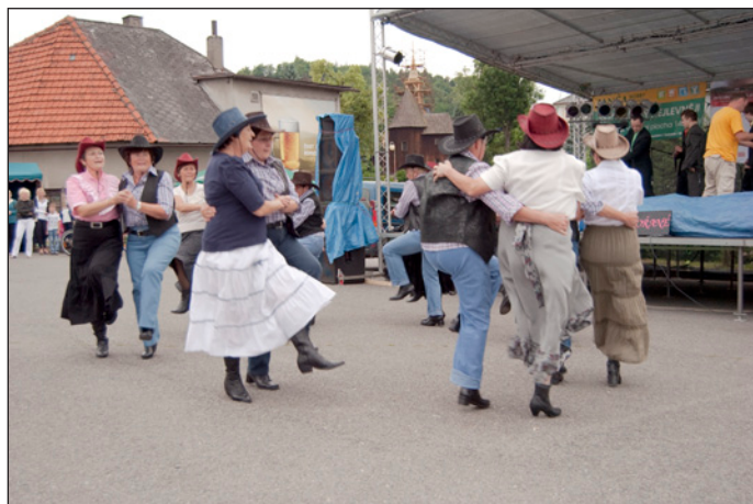
A opět HOBA ...