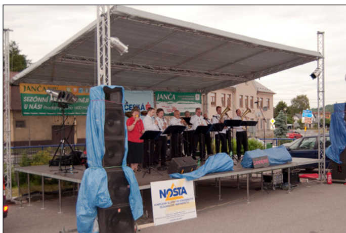
Především pro starší návštěvníky Dne obce zahrála dechová hudba Záhórané