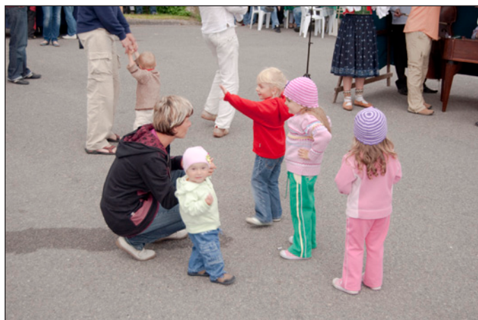
„Hodslavské baby“ zaujaly i naše nejmenší