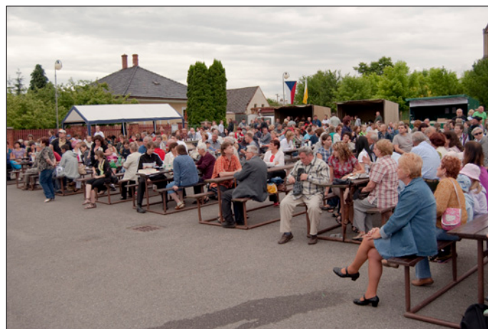
Na Dni obce se nás šeslo opravdu hodně a všichni netrpělivě očekávali další části bohatého programu