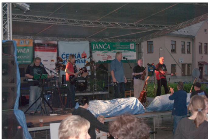
Pro pamětníky zahrála brněnská skupina Synkopy 61