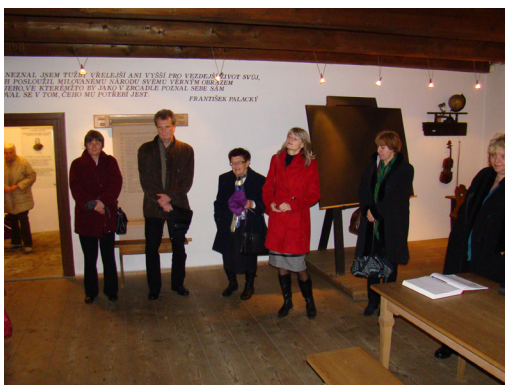
Tradiční zahájení v rodném domku Františka Palackého v 9 hodin ráno.